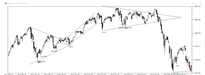
Biểu đồ chỉ số VN-Index

Theo thống kê định lượng, với mẫu hình hôm nay thì phiên giao dịch tiếp theo, VN-Index có xác suất tăng điểm là 63% và 40% giá đóng cửa cao hơn giá mở cửa. Thống kê cho thấy chỉ số sẽ tăng điểm vào ngày mai. Kháng cự là mốc 1,250 điểm và hỗ trợ là 1,150 điểm.